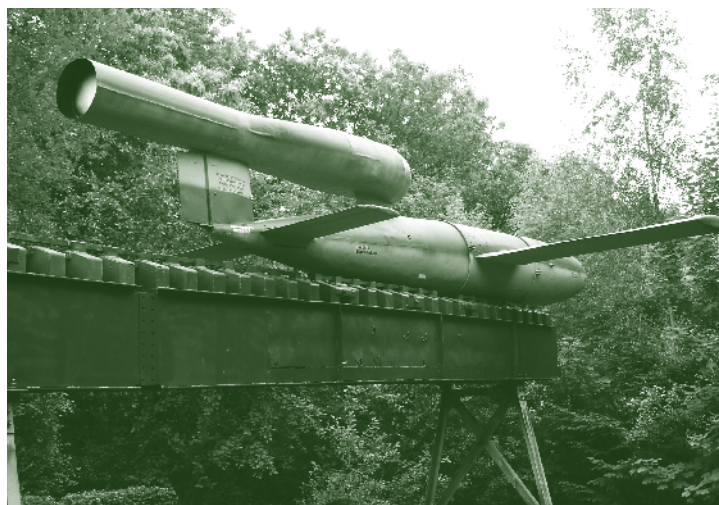
V-1 model, museum Peenemünde