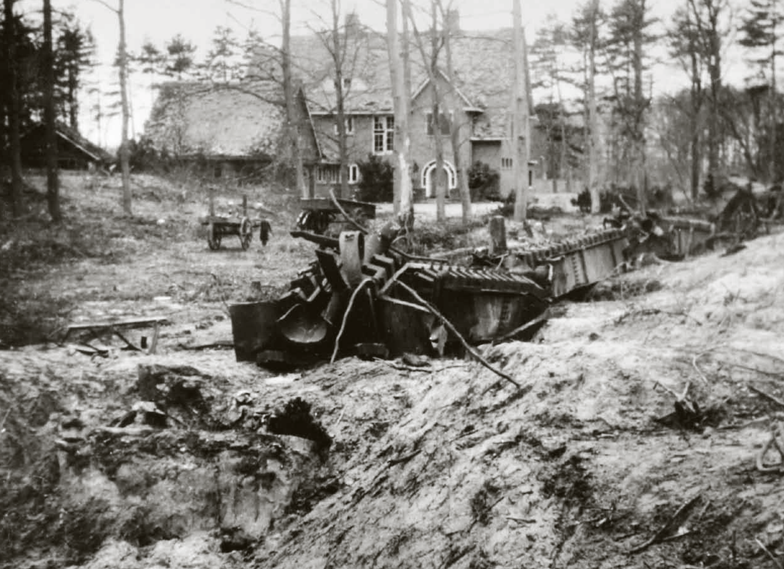
Restanten van de V-1 baan bij villa de Schapenkamp, 1945