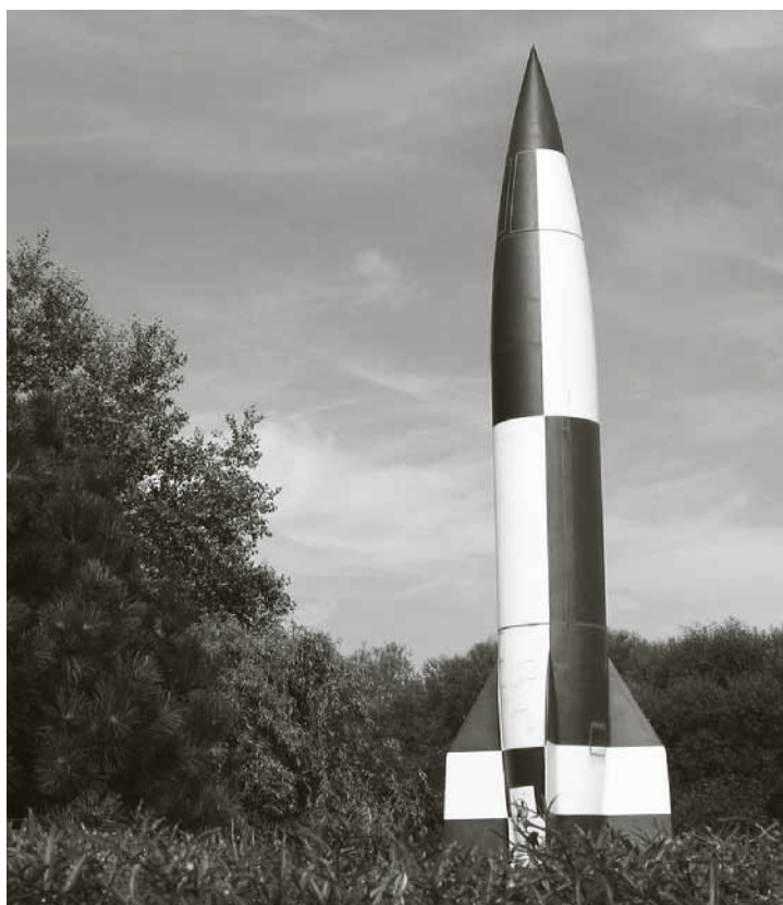
V-2 model, museum Peenemünde